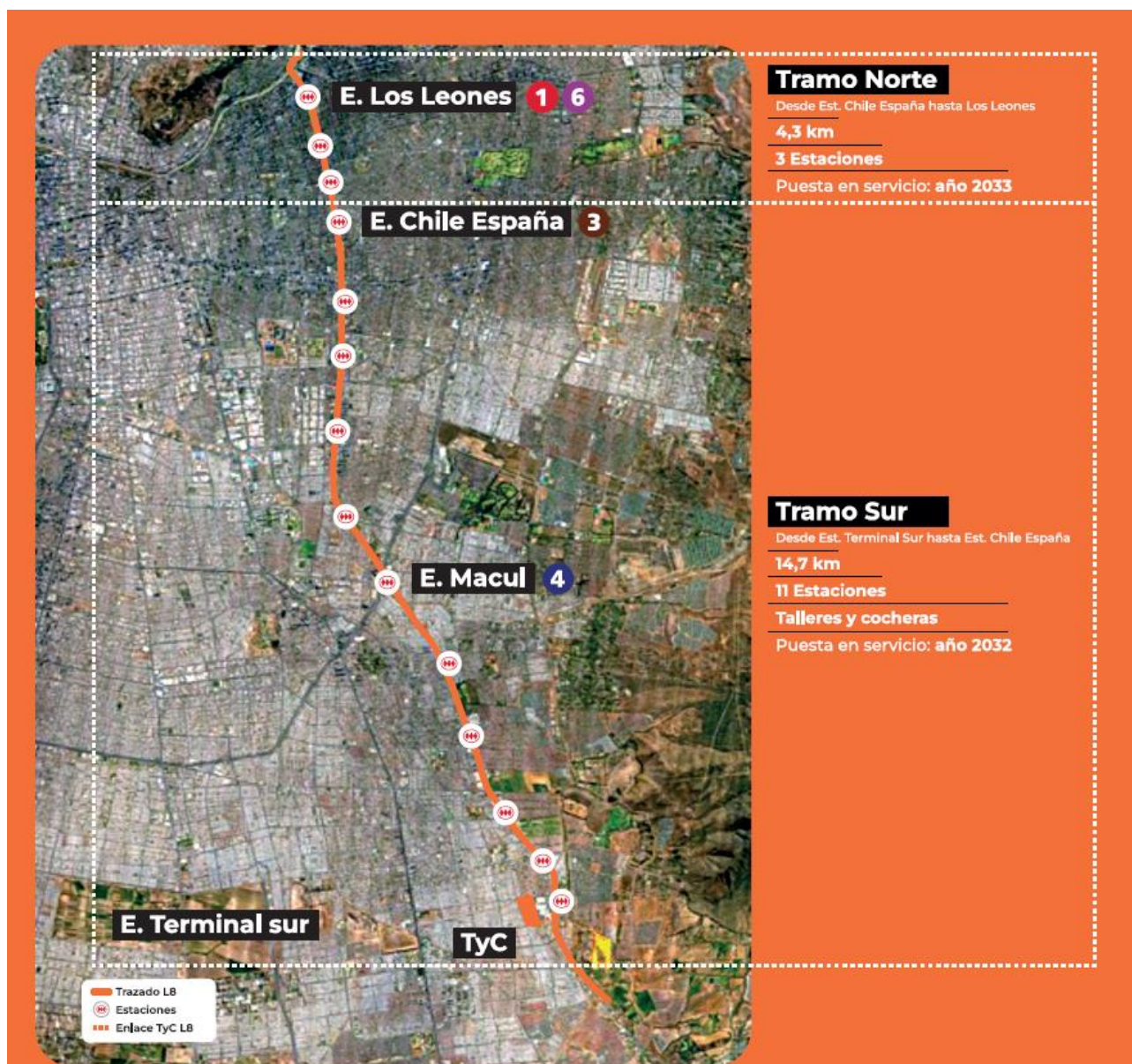
Ilustración 1: Ubicación general Proyecto