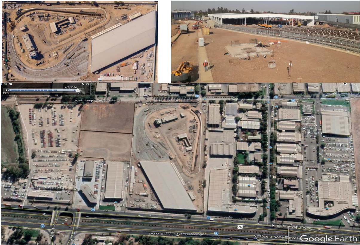
Vistas en Planta y General Cocheras Américo Vespucio Norte, Línea 2