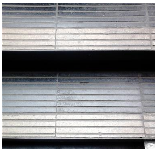
Imagen n°1: Ejemplo Terminación Peldaños Escaleras.

El contratista deberá reemplazar a su costo las baldosas que sean dañadas o perdidas durante la ejecución de los trabajos, además, las nuevas baldosas deberá adquirirlas al proveedor correspondiente, previa aprobación de Metro S.A.