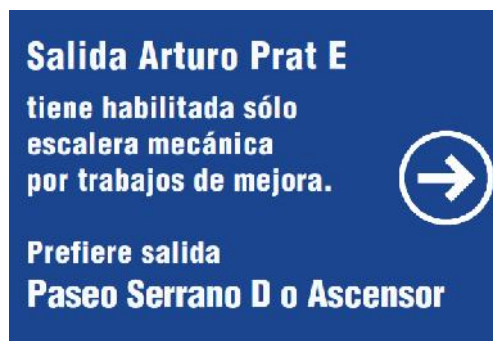
Imagen D2: Ejemplo de Letrero de 60x40cm.