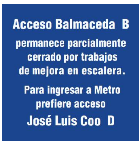
Imagen D1: Ejemplo de Letrero de 100x100cm.

El modelo del letrero será entregado por el Área de Marketing de Metro de Santiago al Contratista oportunamente.