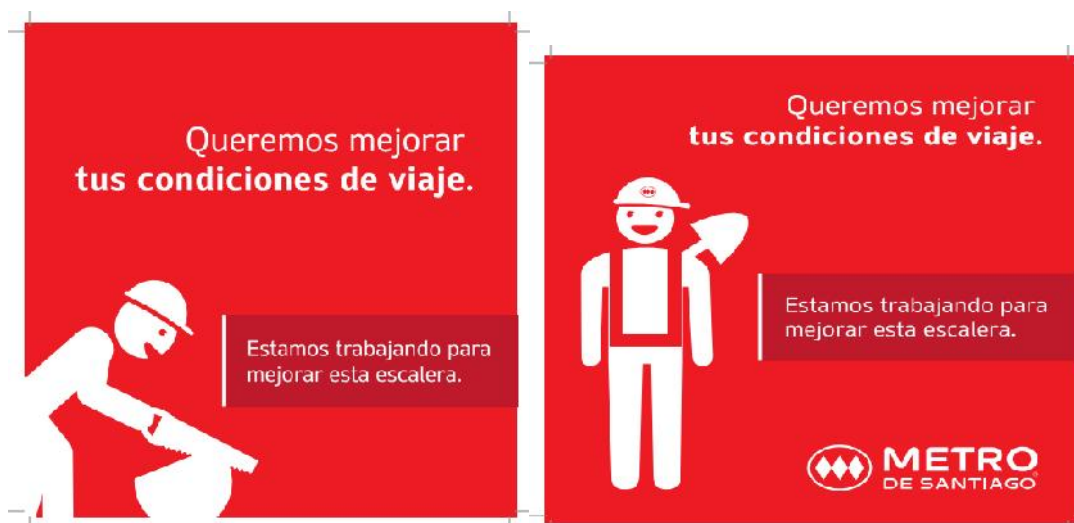
Imagen B1: Ejemplo de Branding a implementar en Cierre Perimetral.