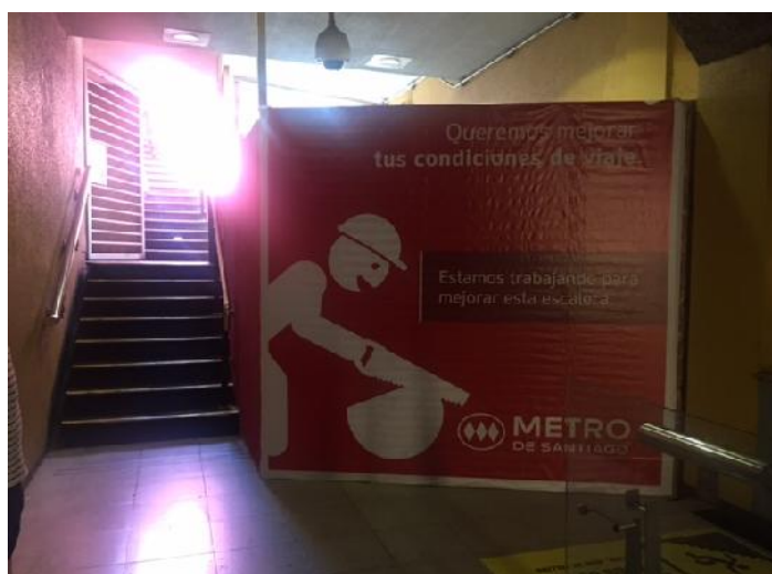
Imagen B2: Ejemplo de “Frente” del Cierre Perimetral.